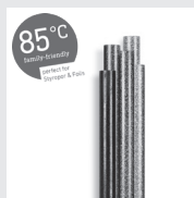
85°C Glitzer Klebesticks 7 mm