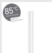
85°C Cristal Klebestick 7 mm