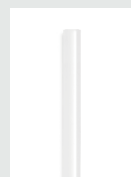
85°C Cristal Klebesticks 7 mm