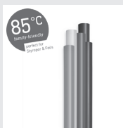
85°C Colour Klebesticks 7 mm