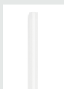
Ultra Power Klebesticks 7 mm